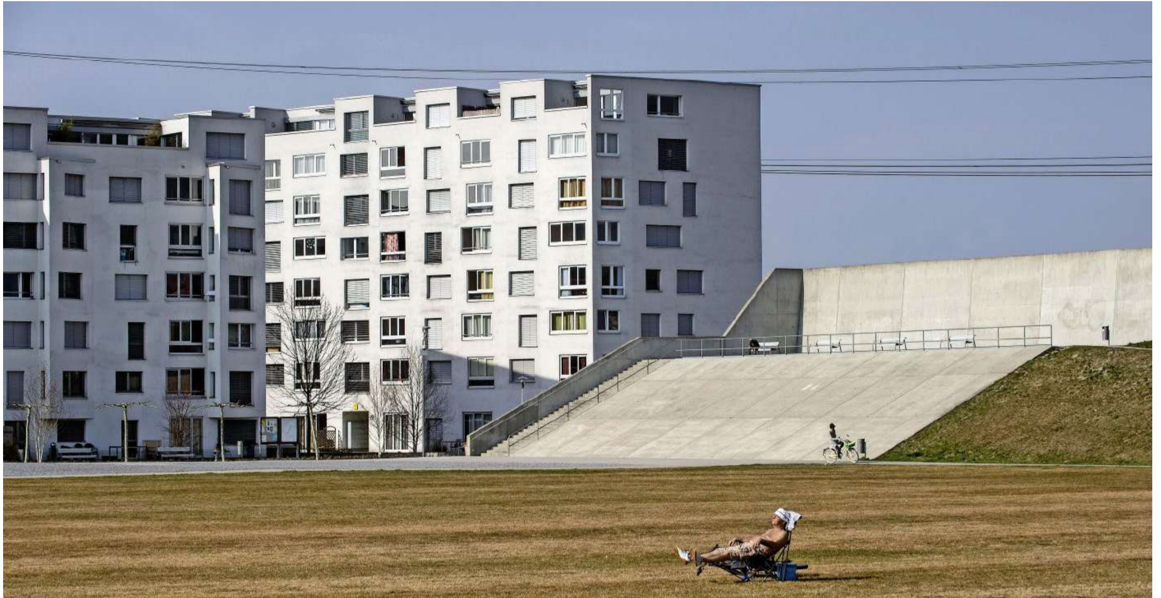
Hochhäuser und ein Erdwall entlang der Autobahn schützen den Opfikerpark und die restliche Siedlung vor Lärm und Gestank.

Die «Pioniere» der Retortensiedlung fühlen sich erstaunlich wohl. Das verdanken sie einem Kultursoziologen, dem Quartierverein und einer Stadt, die mit den Investoren hart verhandelt hat. Ein Quartierporträt von Anita Merkt